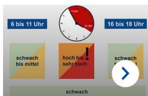
So wirkt UV-Strahlung