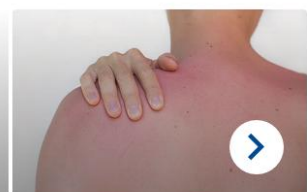
Sechs falsche Annahmen, die Hautkrebs nicht verhindern können

Starten Sie vorbereitet in den Frühling: